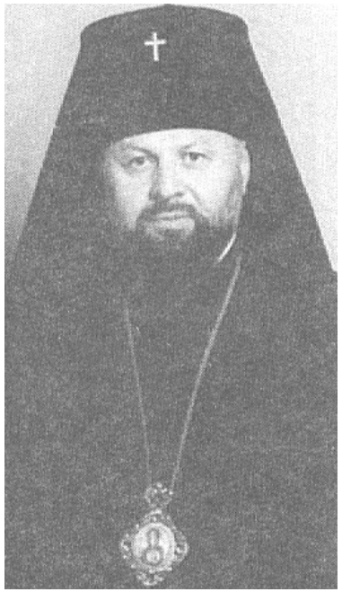
ყოველნი და სრულიად საქართველო, ამინ!

ქრისტე აღდგა! აღდგომა ეს არის ისეთი დღესასწაული, რომელიც ფარავს ყოველივეს ქვეყანაზე, აღდგომა ეს არის ის დიდი ნუგეში და ის დიდი იმედი, რომელიც გვატყობს ყოველთვის და ბოლოსდაბოლოს, ეს არის ჩვენი უკვდავება და მარადიულობა იმ დიდი წყალობისა, რომელიც მოიღო მამამ, ძემ, და სულიწმიდამ კაცობრიობისათვის... სახარებაში სწერია, რომ უფალი იესო ქრისტე ეს არის დიდი სიყვარული და დიდი იმედი კაცობრიობისათვის, ის დიდი მზე სიმართლისა და ის დიდი ჭეშმარიტება, რომელიც მოიაზრებოდა ჯერ კიდევ ანტიკურ ეპოქაში, როგორც ლოგოსი, და დღეს კი მოიაზრება, როგორც ძე და, როგორც სიტყვა—ეს არის წმინდა სამების მთავარი სახე, სამების მთავარი იზოსტასი, ანუ მამა, ძე—თვით უფალი იესო ქრისტე და სულიწმინდა! დღევანდელ დღეს ვულოცავ მთელ ჩვენს ეპარქიას—იმერეთის ამ ძირძველ მიწას და აქედან ვულოცავ სრულიად საქართველოს. ღმერთმა ინებოს ჩვენი ერის აღდგომა, ამაღლება და გამთლიანება, ამინ! და ღმერთმა ბედნიერი აღდგომა გაუთენოს ჩვენს ერს, მთელ ჩვენს ქვეყანას, და ყველა იმ ადამიანს, ვინც დღეს აქ მოვიდა და თავისი ლოცვა—თავისი მსურველი ლოცვა შესწირა უფალს ღვთის საიდუმლად და იმ დიდი სიხარულით აიგოს, იმ დიდი მაცხოვრებელი მადლით, რომელიც აღდგომის ძალაშია გამოვლენილი, როგორც ღვთის დიდი საჩუქარი, რომელიც არის მაცხოვრებელი კაცობრიობისათვის. მე მინდა ვაღმარებო მისი უწმინდესობის, ჩვენი ერის დიდი სულიერი მამის ლოცვა—კურთხევა და მისი ბავით უფალმა დაგლოცოთ თქვენ